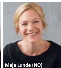
Maja Lunde (NO)