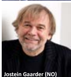
Jostein Gaarder (NO)