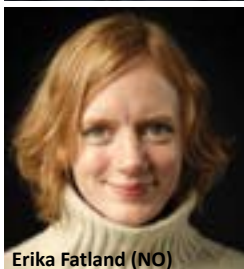
Erika Fatland (NO)