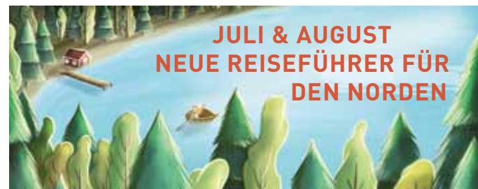
Grafik aus dem Band »Schweden für Kids«

Roman. Ü Tina Flecken. Stroux Edition Mikaels Vater Torfi liegt im Sterben: Auch jetzt bleibt er der exzentrische Freigeist, der nicht auf die Ärzte hören will. Mikael begleitet ihn, erinnert sich und erzählt ... Teil zwei von Torfasons turbulenter Island-Familiensaga. Lesung im September (!) im Felleshus