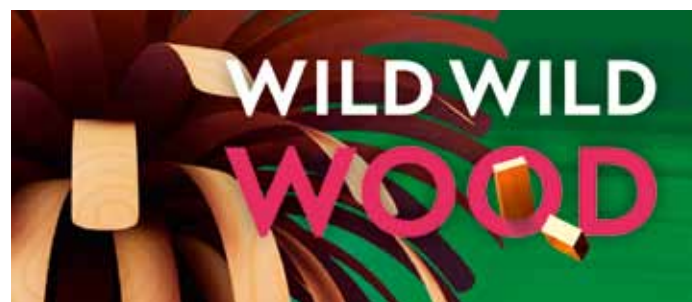
Grafik: Patrick Beier / Heureka

In dieser Ausstellung berührt das Holz die Sinne – und darf selbst berührt werden. Besucher jedes Alters sind eingeladen, mit Holz zu spielen und zu bauen, warum nicht sogar einen Wolkenkratzer? An einer hölzernen Wand darf man kreativ werden und seine Spuren hinterlassen. Unter einem algorithmisch geplanten Laubbaum kann man bezauberndem Vogelgesang lauschen und im Duft des Baumes entspannen. Hier kann die ganze Familie Energie tanken und Holz von ganz verschiedenen Seiten kennenlernen!