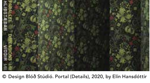
© Design Blóð Stúdíó. Portal (Details), 2020, by Elin Hansdóttir

Die Ausstellung bringt 25 führende zeitgenössische isländische Künstler:innen, Designer:innen und Innovator:innen zusammen, die die Grenzen von Kunst, Technologie und Wissenschaft verschieben und überwinden. Die Auswahl der Arbeiten versucht, verschiedene Welten, Medien und Materialien zusammenzubringen, die ein Tor in eine neue Dimension öffnen. (Teil I der Ausstellung war Anfang 2022 im Felleshus zu sehen.)