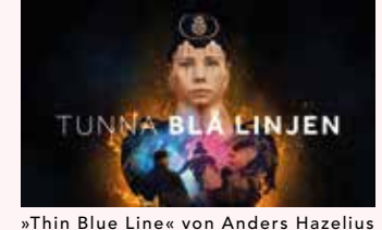
»Thin Blue Line« von Anders Hazelius & Cilla Jackert

Februar ist Berlinale-Zeit! Dazu gehören natürlich auch die nordischen Filmmusiktage mit der Verleihung des HARPA Nordic Film Composers Award. Mit Diskussionen, der Preisverleihung (natürlich mit Live-Musik) – und einem Kinotag mit allen fünf nominierten Filmen.