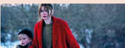
Filmstill aus »Skjálfti | Quake« von Tinna Hrafnadóttir

Die Nordischen Filmmusiktage sind längst ein fester Programmpunkt im Felleshus während der Berlinale, und so freuen wir uns auch in diesem Jahr wieder auf ein Wochenende rund um die Verleihung des HARPA Nordic Film Composers Award. Mit Diskussionen, der Preisverleihung (natürlich mit Live-Musik) – und einem Kinotag mit allen fünf nominierten Filmen.