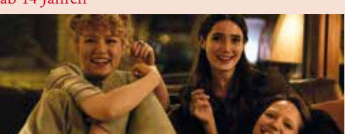
»Girls Girls Girls«

Do, 2.3./19 Uhr »Tytöt tytöt tytöt | Girls Girls Girls« Regie: Alli Haapasalo. Kinder- und Jugendfilm, 2022, 100 Min., OmU, FSK 12, empfohlen ab 14 Jahren