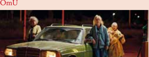
»Teräsléidit | Ladies of Steel«

Mi, 29.3./19 Uhr »Teräsléidit | Ladies of Steel« Regie: Pamela Tola. Komödie, 2020, 87 Min., OmU